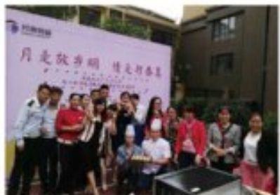
广元邦泰员工欢度中秋