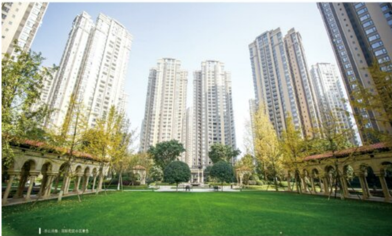
乐山邦泰·国际社区中心景观