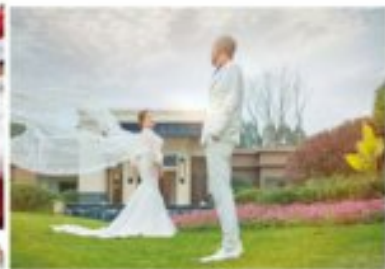
邦泰为中老年业主拍摄婚纱照