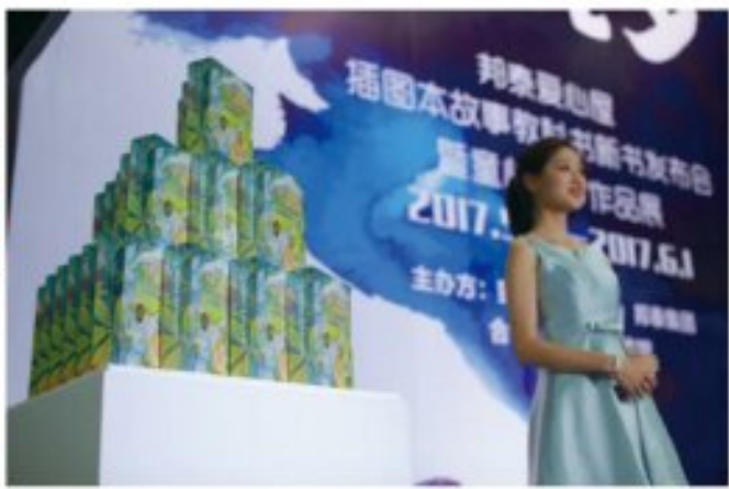
邦泰爱心屋“插图本故事教科书”发布会