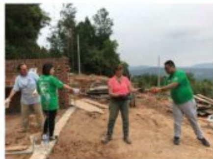
年年和广安邻水县老家参加志愿者援建活动