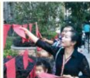
眉山邦泰·锦城国际中秋节猜字谜业主活动