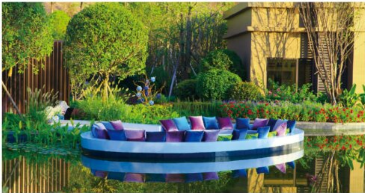
晋京新城·天豪祥泰展示区

当然，对于每一类完工项目的后期检查也是不容忽视的重要流程。邦泰集团的设计工程管理中心有一套极其严苛的工程检测标准，其中关键的细节都要到每个项目的现场大小都可能出现，考虑完善。一个项目从前期施工过程到最后的交付，工程部非常需要不断地和合作供应商、施工单位、设计单位、监理单位等就工程质量、进度、安全文明等方面进行全方位的沟通交流，同时把好质量关卡，绝不就一般安全隐患问题任