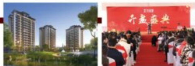
西昌邦泰·花园城首场开盘盛典