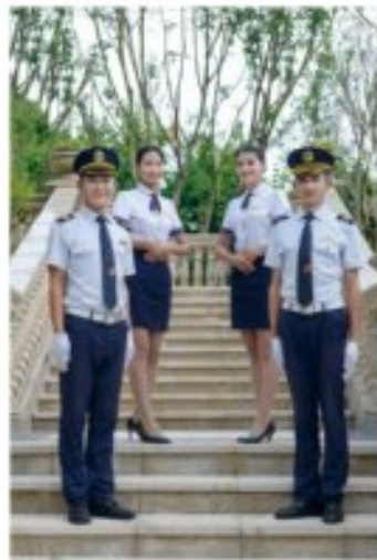
■ 在数方美的物业服务人员

何为具有“家文化”的物业服务？邦泰所有的物业服务部门都有着严格统一的服务标准，部门分工明确，职责划分有序，得益于邦泰制定很好的人性化服务标准，他们呈