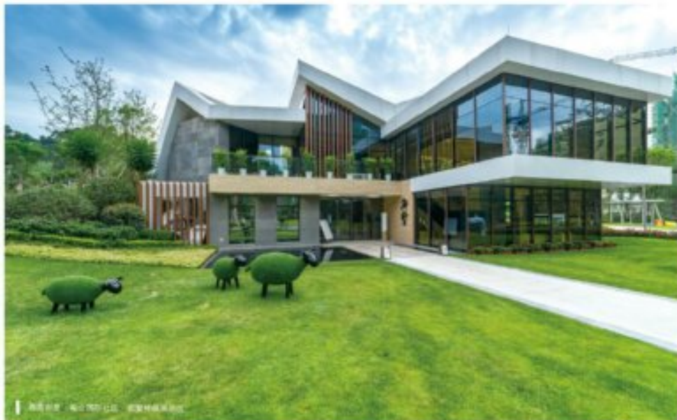
西昌邦泰·南山国际社区·新翠项目实景图

答：2018年，西昌公司在集团战略的指引下，继续提升服务质量，提高业主满意度，进一步扩大邦泰集团在西昌的品牌影响力，高质量的完成西昌邦泰·南山国际社区、德康项目的交付工作，争取达到交付满意度百分之九十五以上。同时，紧跟工程进度和质量，加快建设西昌邦泰·南山国际社区·新翠和西江岸·花城项目，兑现业主承诺，为全体业主交上一份满意的答卷。我们将进一步提升物业管理水平，在社区配套设施的建设和物业服务拓展方面取得突破。