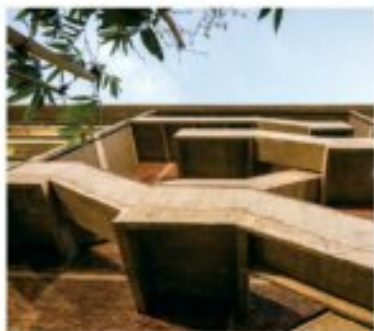
西村大院木质框架之美