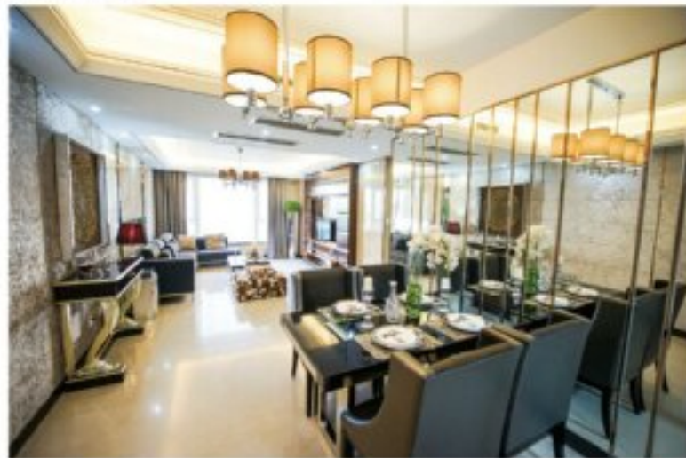
乐山邦泰·国际社区样板间