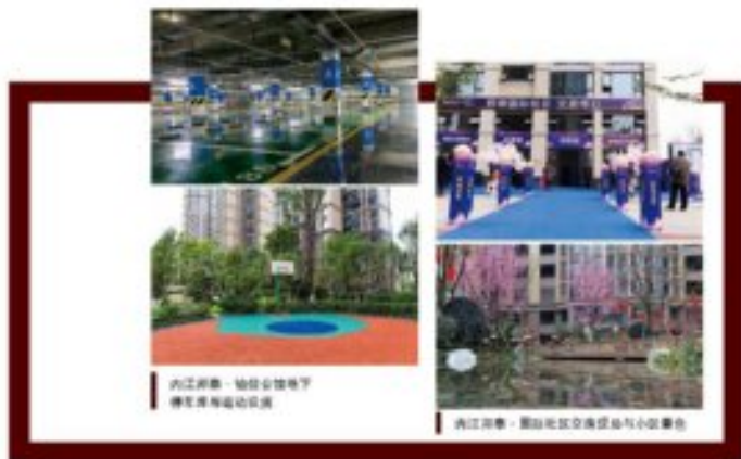
内江邦泰·铂仕公馆业主交房现场