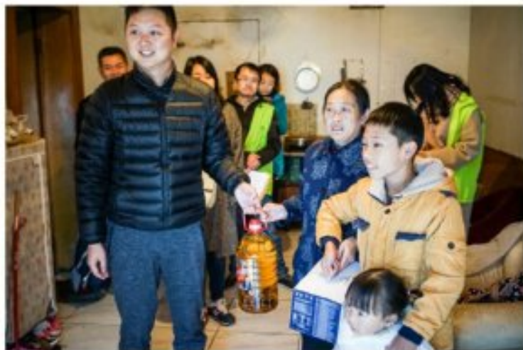
乐山市慈善基金会工作人员向受助家庭送发各种生活用品

热情地招待了我们,搬出家里的凳子,拿出新鲜的水果来招待我们。他们还主动地告知自己的情况,让我们不要担心。而这些困难家庭的孩子,虽然大多不善言谈且略显羞涩,但他们的眼神从只到个中透露出孩子没有被生活的压力打垮,依然保持着乐观的大气乐观以及对未来的信心期待,让人感动欣慰。