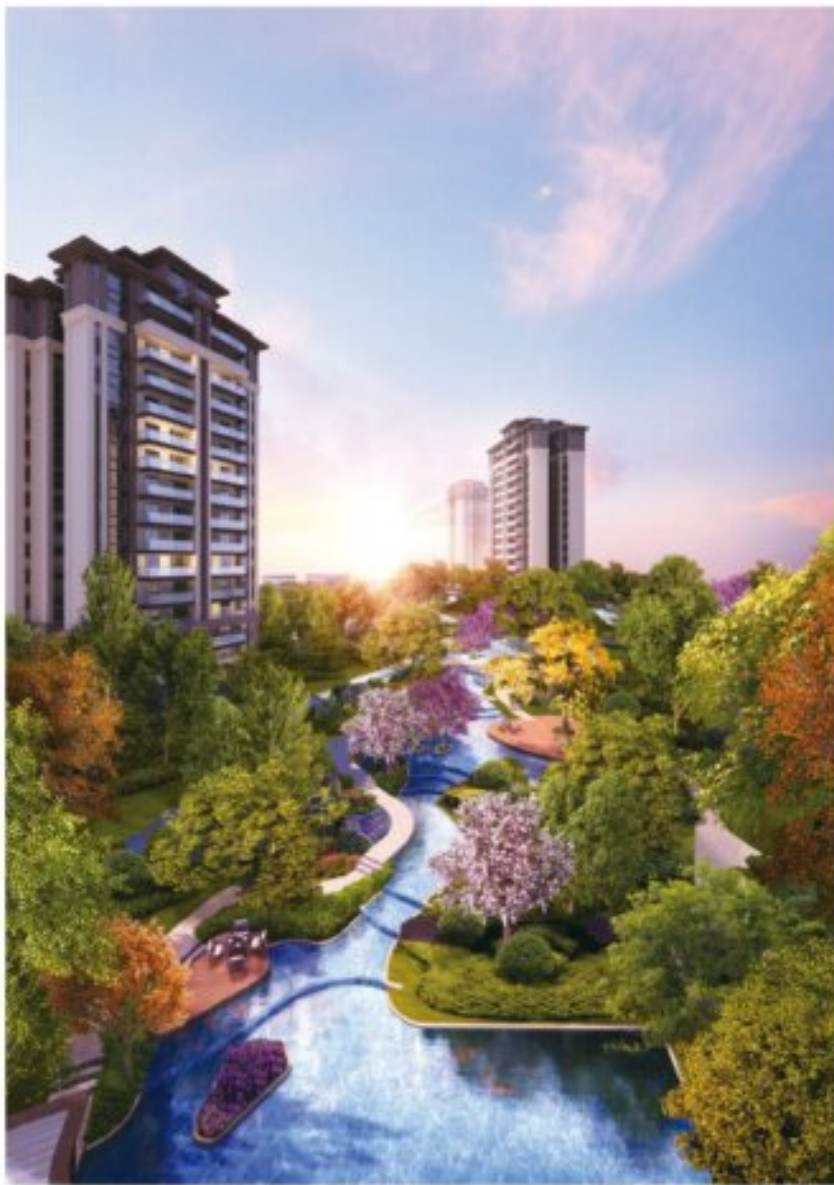
宜宾邦泰·白沙湾实景图