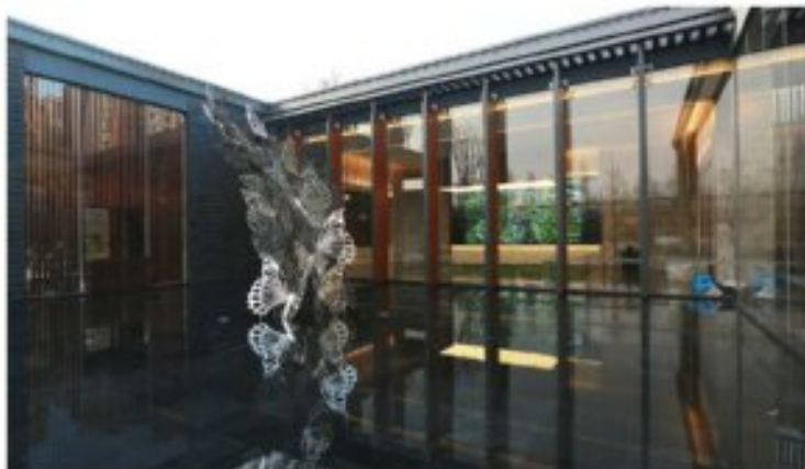
晋京新城·天豪购物中心

对一家房地产开发商来讲，最想要的是什么？一定是房子。过硬的户型品质、出色的建筑设计、贴心的物业服务都必不可少，也要给他人“家”的概念，同时又有舒适安全的居住环境，这些才是消费者愿意掏钱、愿意为回家之信首先考虑的事情。而成为邦泰集团的业主或者客户，对邦泰集团的产品品质应该早有耳闻。在集团的企业责任驱使下，邦泰将上下一心，为消费者建造出了一个个高品质的精品楼盘。