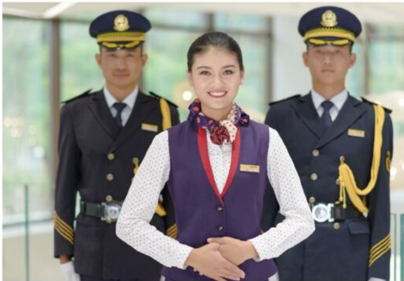
邦泰物业贴心提供“五个百分百”贴心服务

“品质服务”一直是邦泰集团最为看重的品牌之魂，“客户第一”则是摒弃一切外因素的最高服务宗旨。在此基础上，邦泰集团用一颗火热真心来打造安全放心的居住环境，并秉着专业精神致力于搭建和谐人文的社区居住环境。“邦泰汇生活 APP”的问世与升级更迭，邦泰汇生活服务体系·V 社区正式发布执行印证了邦泰品质服务的决心，当中更着重强调了基础服务、生活服务、文化服务和智能服务的全面建设，呼吁所有邦泰人齐心协力打造一个集功能性、服务性、创新性为一体的虚拟智能现代化社区。