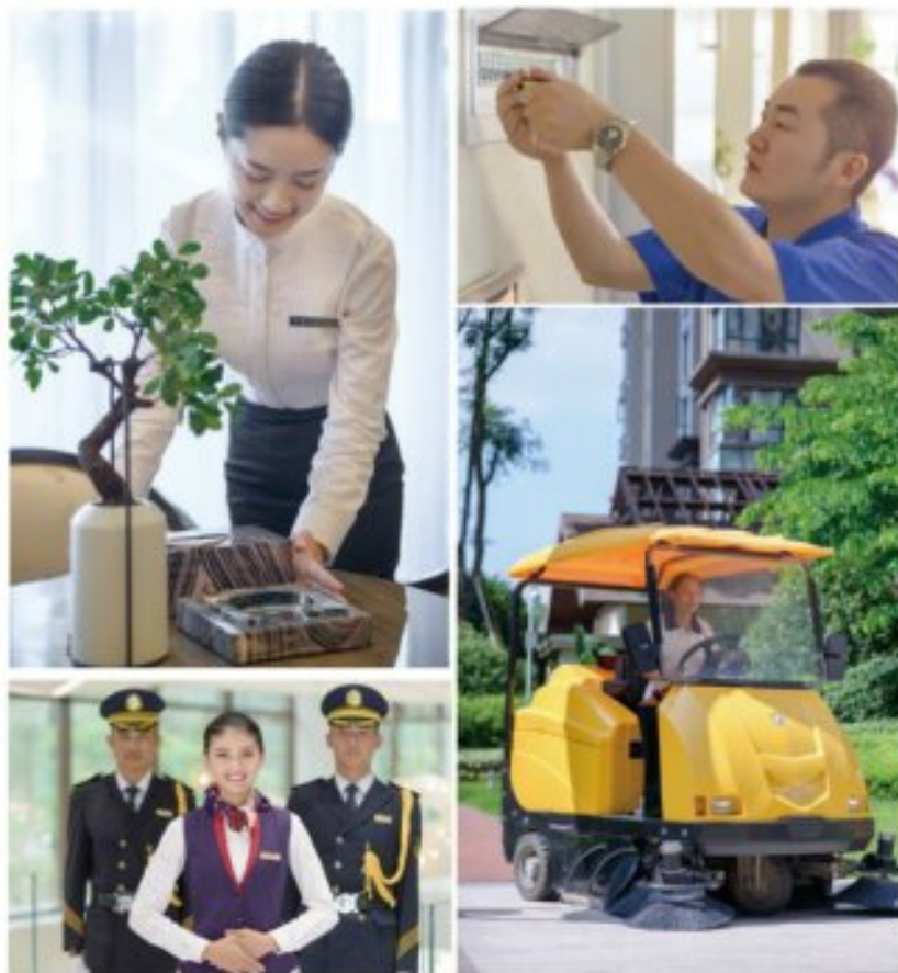
■ 物业服务工为业主和客户提供有品质的物业服务

从环境卫生到秩序维护,从设施维护到设备养护,保安站、保洁员、绿化员、维修工……每一天都坚守在自己的岗位上,用双手清扫小区道路,养护树木花草,保障水电安全,保障业主财产安全,守护社区安宁,始终履行着让业主安居乐业的神圣使命,他们在平凡的岗位上,却做着不平凡的工作。看似简单的保洁服务、园艺服务、维修服务、安保服务、秩序服务和客服接待,每一项贴心服务背后都有一群默默无名的邦泰员工,虽然你可能每天和他们擦肩而过却记不住这些人的名字,可是他们用实际行动履行了作为一个邦泰人最令人骄傲的使命——让业主的生活更加便利。☺