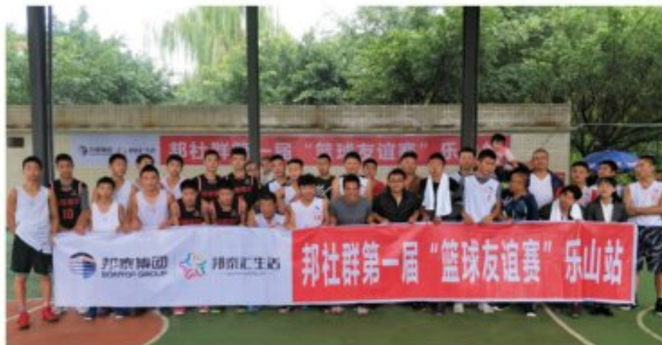
邦社群“篮球友谊赛”乐山站