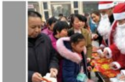
邦泰物业为业主发放圣诞礼物