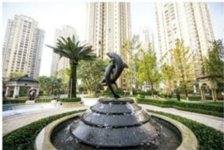
乐山邦泰·国际社区小区内景

本次交付交付的是乐山邦泰·国际社区一期二批次 的17个住宅单元和3个商业单元，共计306套房源。 为了尽可能满足购房业主的经验交付需求，公司特 地制定了40天的超长交付期，确保每天都有专人在 现场接待办理相关手续。8月20日交付当天，第一批 通知购房的180组客户交付满意度高达99%。