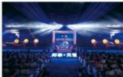
内江邦泰·天誉发布会现场