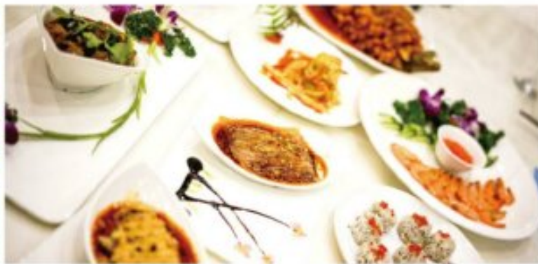
午餐由乐山美食家精心烹制不重口