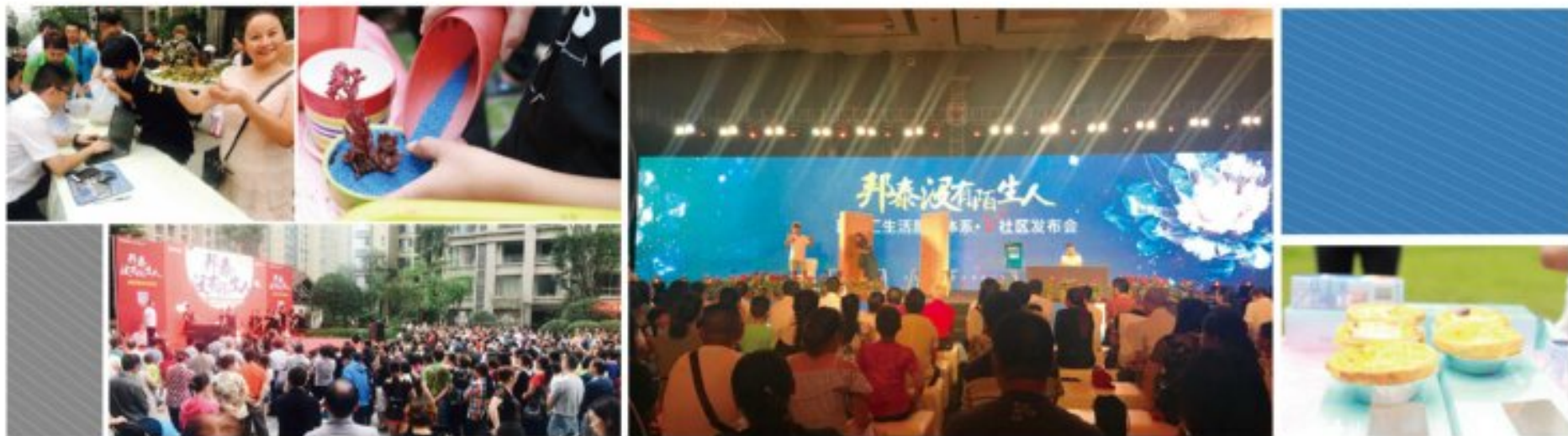
| 平康多利由邦泰汇生活服务体系 → 社区活动