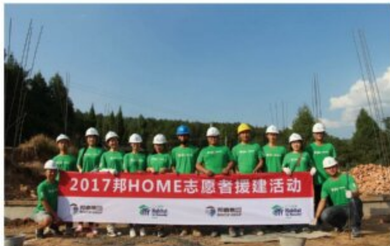
志愿者们合影留念