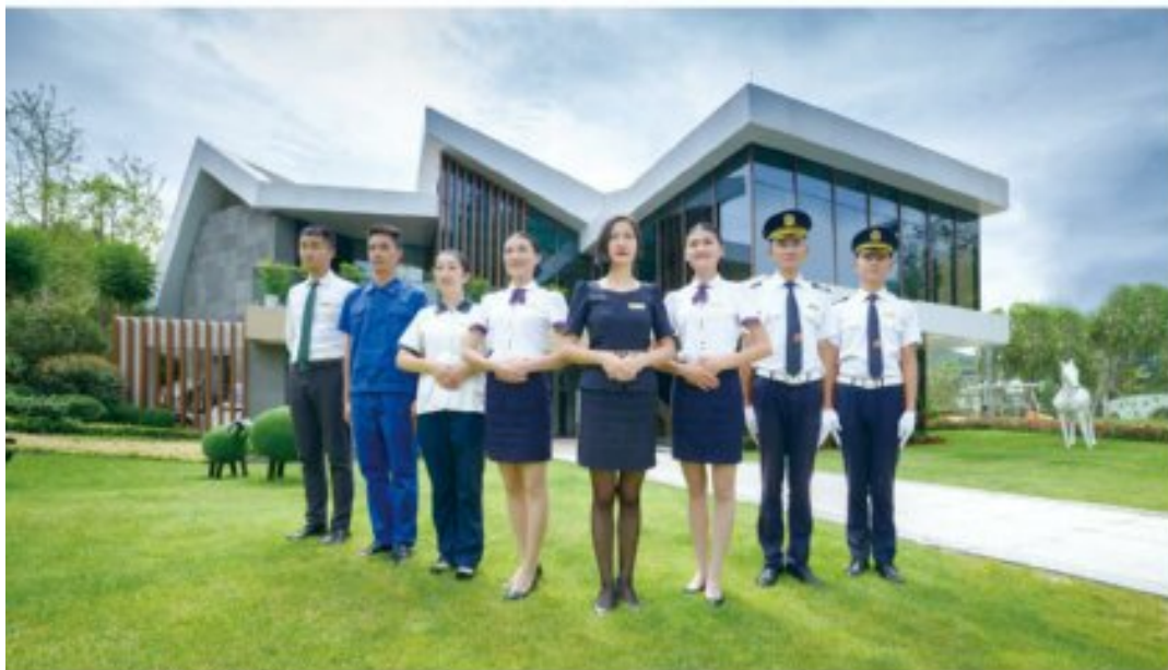
■ 邦泰集团的物业服务人员

行妥善。他们通过这些施工单位的“见证地”，印证了邦泰业主心中最值得信赖的安全守护。