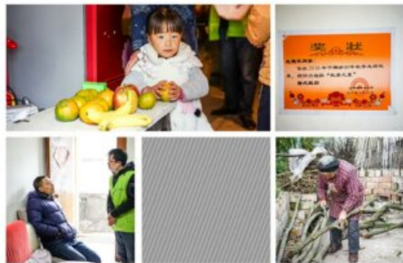
上图为乐山市慈善基金会开展的公益活动

在我们探访期间,正值寒假前夕,学生们都放假在家度过新年假期,我们偶然见到了这些可爱活泼的留守儿童。这些留守儿童一部分为了孩子上学租住在县城,他们基本在县城中都租住在偏远的角落,和这乱天壤之中增加了他们的开支。一部分留守儿童县城不远的月保村,月保村位于大渡河大渡河的悬崖峭壁之上,山路崎岖,除了孩子上学的时候,他们也很少下山。