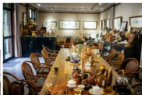
霍晓的生活为中式餐桌环境