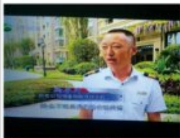
宜宾电视台报道邦泰公馆物业人员拾金不昧