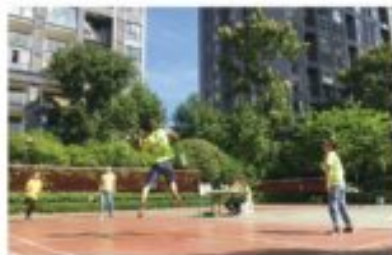
邦泰员工积极参与丰富的团建活动