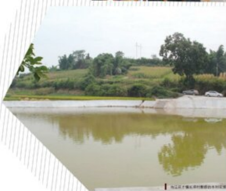
内江双才镇长冲村精准扶贫水利设施