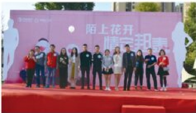
「邦泰·悦生活」活动现场

邦泰置业团队与业主们的交流,业主们畅所欲言,提出了二十个不同的意见和建议,很多业主现场不约而同地提出了同样的建议,因为邦泰置业团队懂得倾听——一个“与业主面对面交流”的举动。此次客户见面会的成功举办赢得了更多业主的心声,让业主们更清楚地了解邦泰,也让业主们更清楚地了解邦泰。