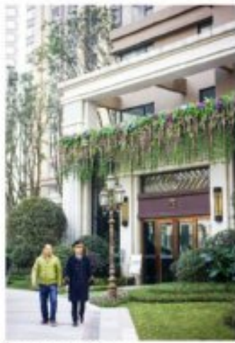
物业人员带领业主参观小区

交付现场，不少业主在办理完收房手续后，都主动下载了“邦 泰汇生活APP”。据了解，作为乐山物业服务的第一品牌，乐山 邦泰·国际社区开创了全新的社区服务模式——“汇生活” 模式。架空层内的八大主题会所，让业主可以在社区内就能 方便的解决孩子课余时间安排问题，解决老人的健康问题， 还可以享受瑜伽的健身、娱乐、会客场地和服务，更可以足不出户 解决回家生活比如交水电费的一切问题。为了向业主 提供更好更快的服务，所有的这些项目，都会在APP平台上 实现，只要轻轻一点，专业的服务人员就会上门，或者提前为 你做疑难杂症工作，关于生活的一切服务，都会在这个平台上 轻松实现。随着时代的推移，将会有更多的业主入住乐山邦 泰·国际社区，而邦泰已经做好准备，将更加努力为主业市 上更好、更舒适、更有品质的高尚生活。◎