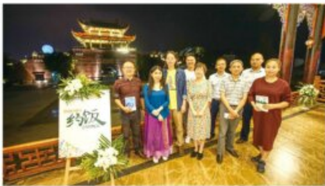
约饭现场其乐融融