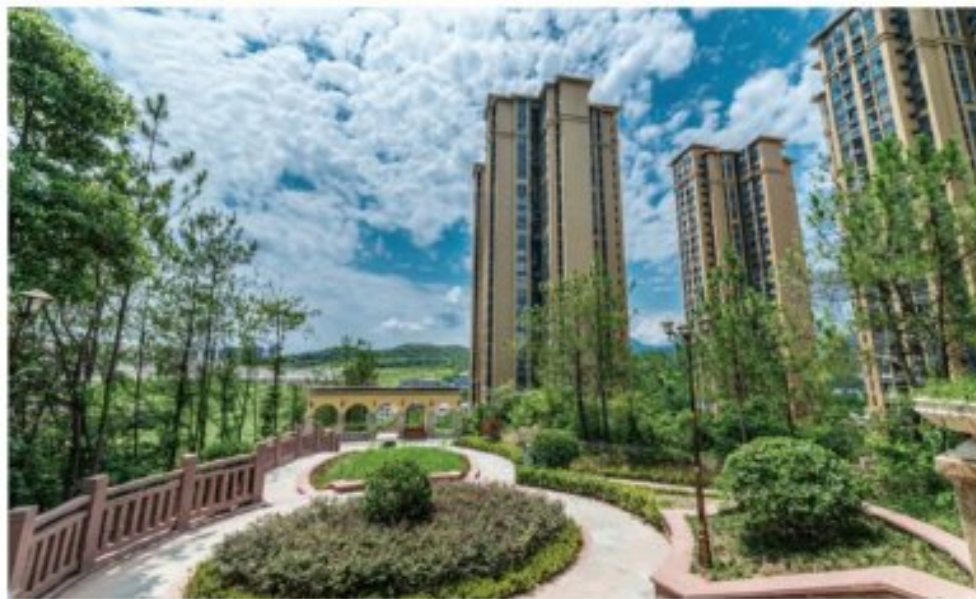
广元邦泰·锦城森林实景图