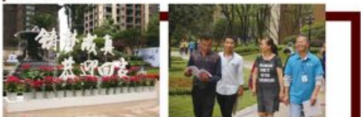
宜宾邦泰·国际社区首批次业主交房

邦泰2002年进军宜宾时,在短短五年时间内便先后推出宜宾邦泰·铂仕公馆、宜宾邦泰·铂仕公馆·国际社区、宜宾邦泰·国际社区·花城等项目。并且在宜宾获得了不俗的销量,获得了极好的口碑和关注度。在未来邦泰会一直坚持“客户第一”的核心价值观,通过品质服务,给宜宾人带来更好的人居产品。