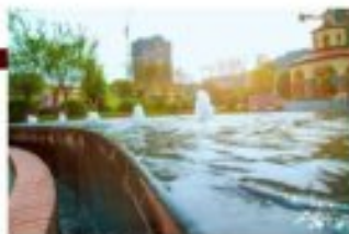
广元·邦泰·康悦实景

2007年,邦泰用自己的实力证明在川内房地产市场不可撼动的地位。从乐山邦泰·国际社区·宜宾邦泰·天誉,宜宾邦泰·天誉,筠内邦泰·天誉,西昌邦泰·花田城等项目,再加上乐山市场上新斩获的青江地块,在前十年出世的邦泰让所有人感知到这家房企的实力与决心。◎