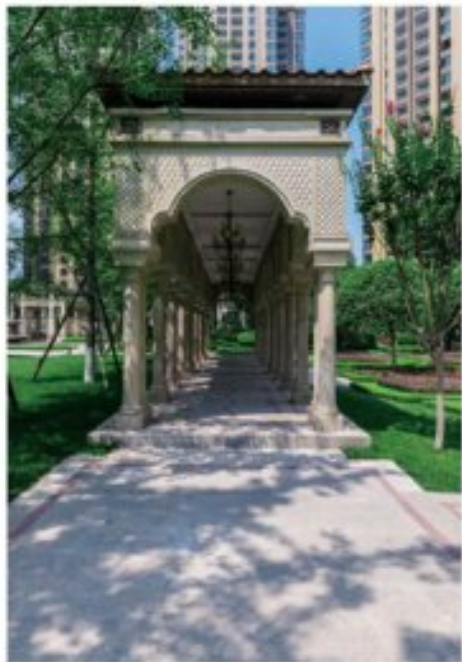
泰山祥泰·国际社区