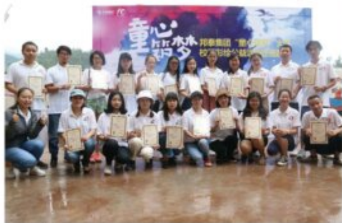
邦泰集团2017年“童心无价”黔北社区关爱留守儿童活动