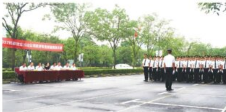
邦泰物业 2017 年岗位技能大比拼活动现场