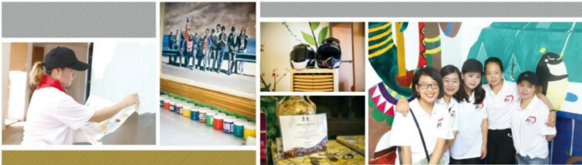
参与邦泰爱心屋彩绘的志愿者们