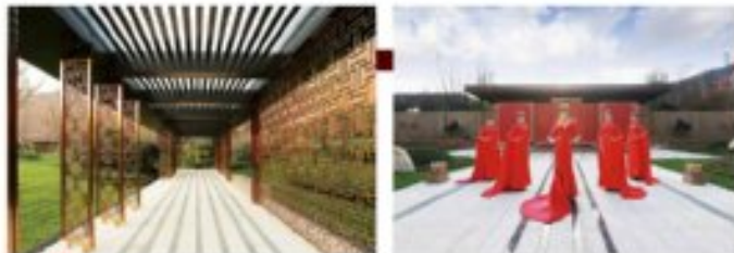
宜宾邦泰·天誉营销中心售楼部

2017年12月30日,在宜宾大地之上,宜宾邦泰·天誉营销中心重新在亚洲园林示范区,如凤凰般绽放。上午9时30分,激昂的鼓声,舞动的红旗,在激昂的倒计时声后,一场跨越时空而生的王冠盛典缓缓开启,红衣少女舞蹈的灯舞在夜空中翩然起舞,迎接每一位慕名而来的宾客。