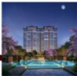
乐山·邦泰国际社区3·天誉轻奢