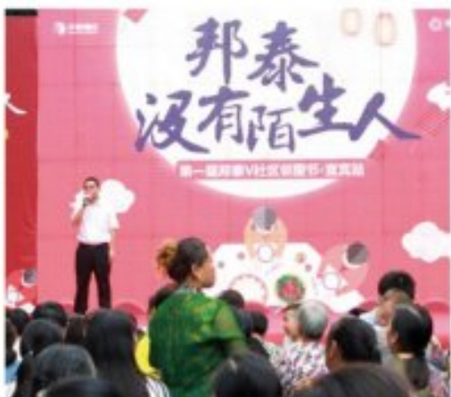
邦泰“没有陌生人”V社区论坛演讲

童人的价值,改善生活方式,关心生态环境,关怀更多不同群体的居住需求,积极参与各种社会公益事业。正是如此,邦泰集团通过为贫困地区修建水利设施、修建道路等方式从根本上改善当地村民改善村居的生活状况,让他们在邦泰集团的帮助下理解自力更生美好生活。