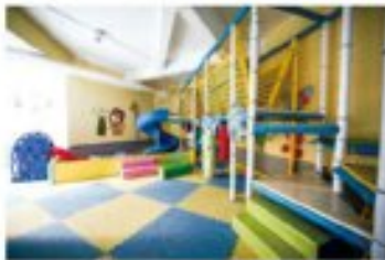
乐山邦泰·国际社区各种儿童游乐设施

到了业主的高度认可。在细节方面，仅标识牌一项就 花费30余万元，全部采用高档玫瑰金材质，大到单 元标识、小房号牌、楼层都有标识指示。本批次交付 的27栋、28栋、29栋、30栋住宅均有限空层送会所， 并赠送业主车库。电梯采用的是知名品牌通力电 梯。设置小区8万平方米的皇家园林园林中庭 景观、2000平方米的游泳池、5000平方米的人工湖等 ——景观在眼前，大气沉稳而内敛，行在其间，回家似