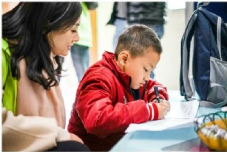
志愿者与尘肺病人家属的小朋友在一起

矿资源，山上遍种的钒矿就像马蜂窝，被称为四川的“小西藏”，本地和邻县的许多年轻人都会去那里淘金。在矿场里，由于缺乏安全意识和保护措施，一只掏金的口子根本不能阻挡铺天盖地的粉尘，住在该出的棚里也带着灰，但没人把这些粉尘当回事。由于尘肺病潜伏期长达3-20年，等到他们感觉胸闷、咳嗽不停时，他们的肺部已经发生质变，甚至呼吸都变得非常困难，特别是在冬季，是他们最艰难的日子。他们年轻时在矿中度过自己的青春，却平日的付出为这个城市的发展做出了贡献，却换来晚年完全丧失劳动能力，甚至连睡觉都不能平躺，只能保持微弱的姿势，而最终也以这样的姿势来迎接他们生命的终结。由于缺乏医保以及劳动合同的缺失，他们能得到的赔偿也非常有限，为了看他们几乎是倾家荡产，而且尘肺病到病发时难以救治的惨状，只能吃着最原始的药膳，死扛就像一颗定时都会爆炸的定时炸弹，心理上的折磨更是让病人及家属感到痛苦。