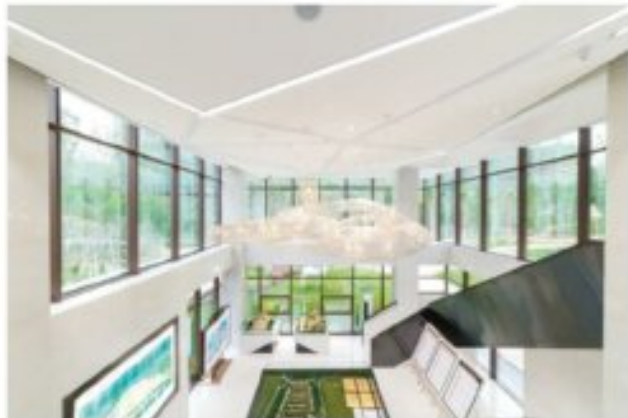
西昌邦泰·南山国际社区·康馨样板间与营销中心

在内江，邦泰集团所开发的楼盘不仅给予业主自然山居的生活，更以如今快速构架配建新兴的高新区多出一份惊喜般的生态景观。而这样的现象，也绝非仅限于内江——当邦泰集团在西昌倾力推出邦泰·南山国际社区触发受到西昌市民的追捧，一部分开发商才发现，原来邦泰集团能大幅提升的楼盘和市民口碑带来的不仅是经济效益，同样也是为西昌的城市建设，为当地的现代化出了一份绵力。