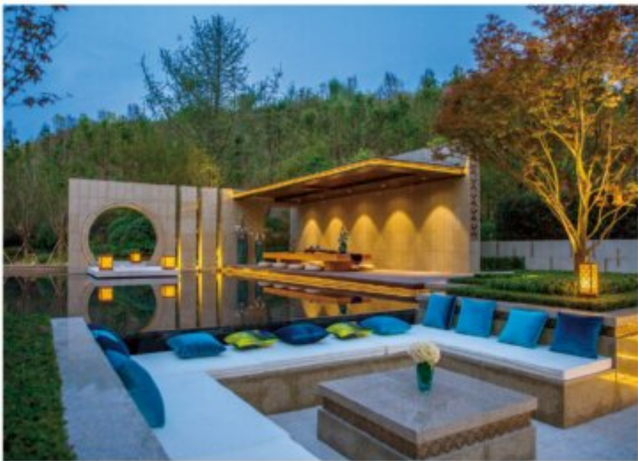
内江新寨·天香村温泉中心

2017年注定是充满着挑战和惊喜的一年。但是无论是处于逆境或顺境，分布在各个城市的邦泰带头人始终坚信“谋求发展，不违初心”。不仅取得了让人惊喜的成绩，而且在城市发展中也做出了重要的贡献。而新一年的邦泰，他们也会不忘初心，再接再厉。