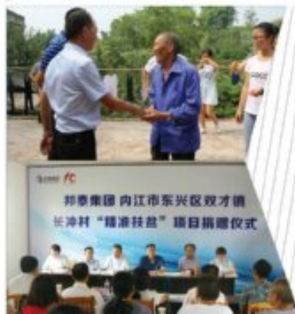
邦泰内江公司高管领导亲赴双才镇，参与捐赠