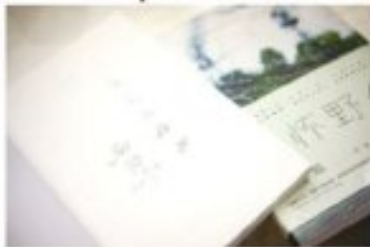
西门和西门只因为美食聊起那家集团

除了著名火锅,乐山的美食更是琳琅满目。钵钵鸡、串串、红油鸡、糯米丸子、豆腐脑等美食在天街都能吃到,而且绝对是麻辣过瘾的。西门和西门对钵钵鸡和串串赞不绝口。大家一边吃,一边聊,那家集团乐山公司负责人还一向嘉宾们介绍那家集团美食。